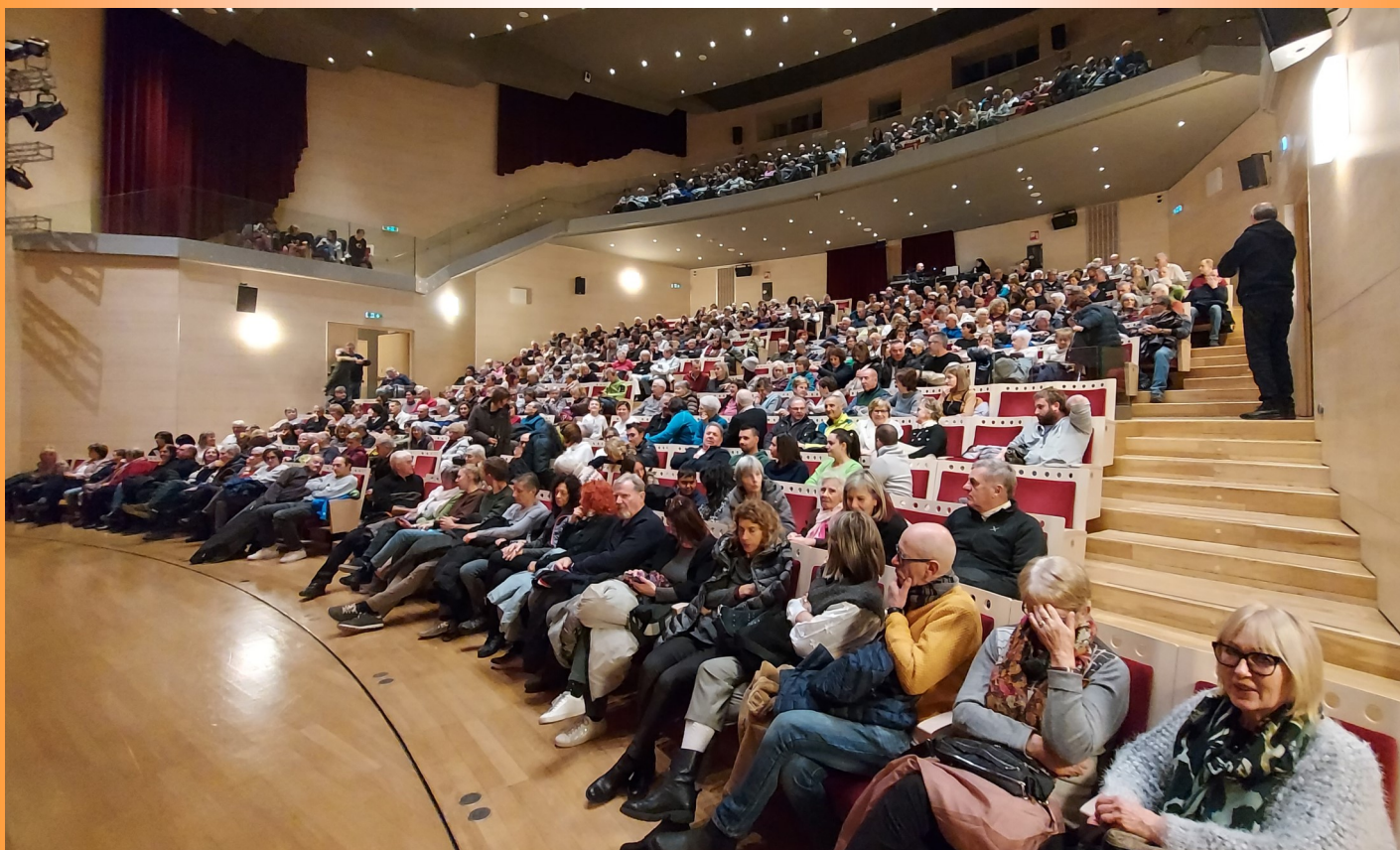
Lo spettacolo iniziale del NOSTRO affezionato Pubblico

Grazie soprattutto al nostro fantastico pubblico che sa partecipare con passione, divertirsi, riconoscere e apprezzare il buon teatro.